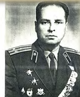
Полковник 1954-1968 г.г.