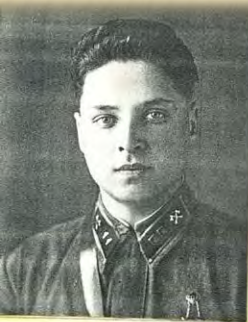
Лейтенант 1939-1941 г.г.