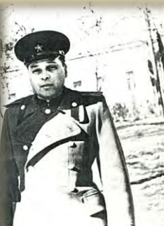
Капитан 1942-1943 г.г.