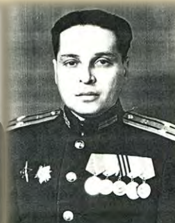
Подполковник 1948-1954 г.г.