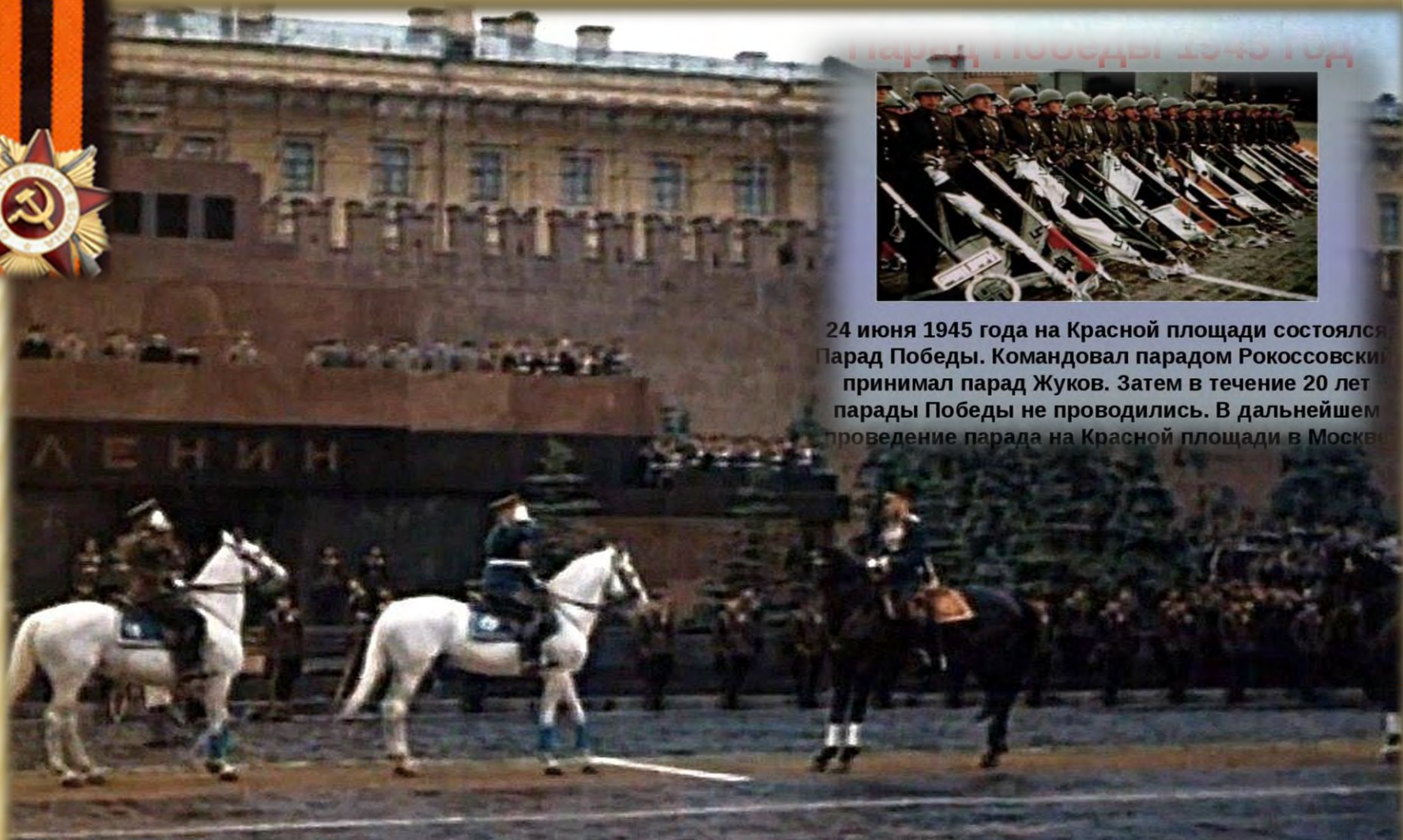
Парад Победы 1945 год