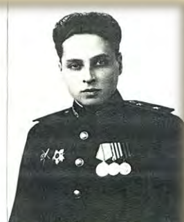
Майор 1943-1948 г.г.