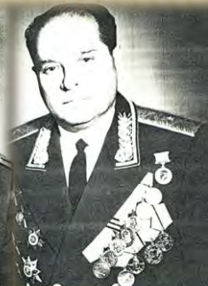
Генерал-майор с 1968 г.