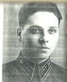
Старший лейтенант 1941-1942 г.г.